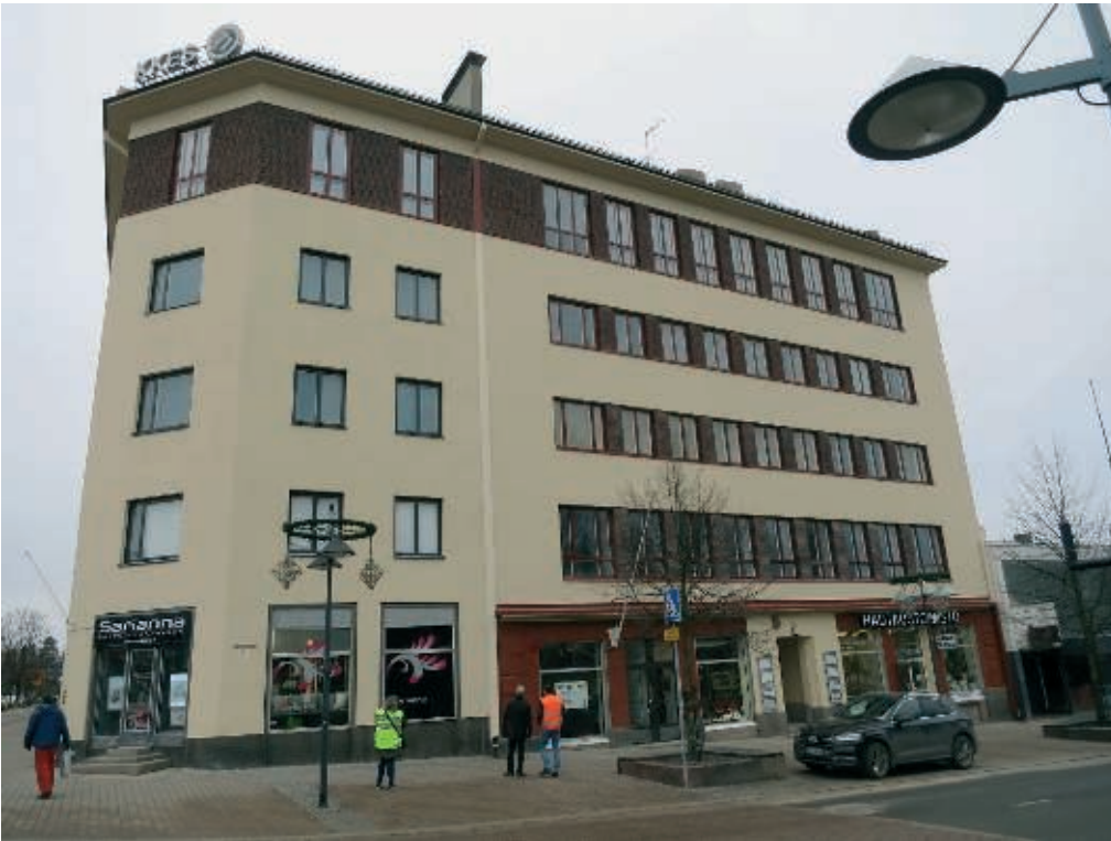
Lappeenrannan Karjalankulman suojeltu julkisivu kunnostettiin kesällä 2021.