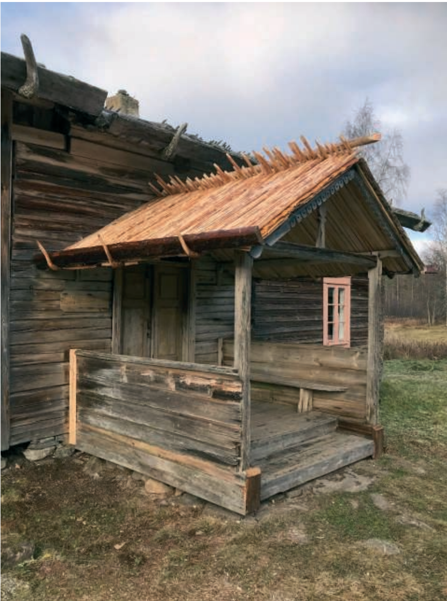
Murtovaaran päärakennuksen uusittu sisäänkäynti.