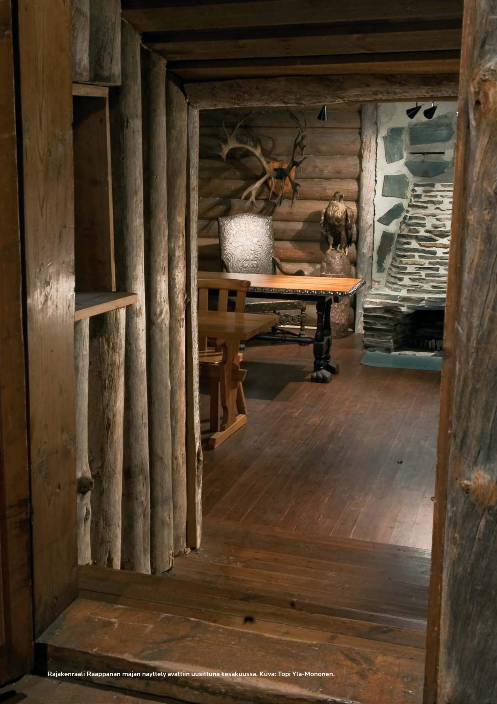
Rajakenraali Raappanan majan näyttely avattiin uusittuna kesäkuussa.