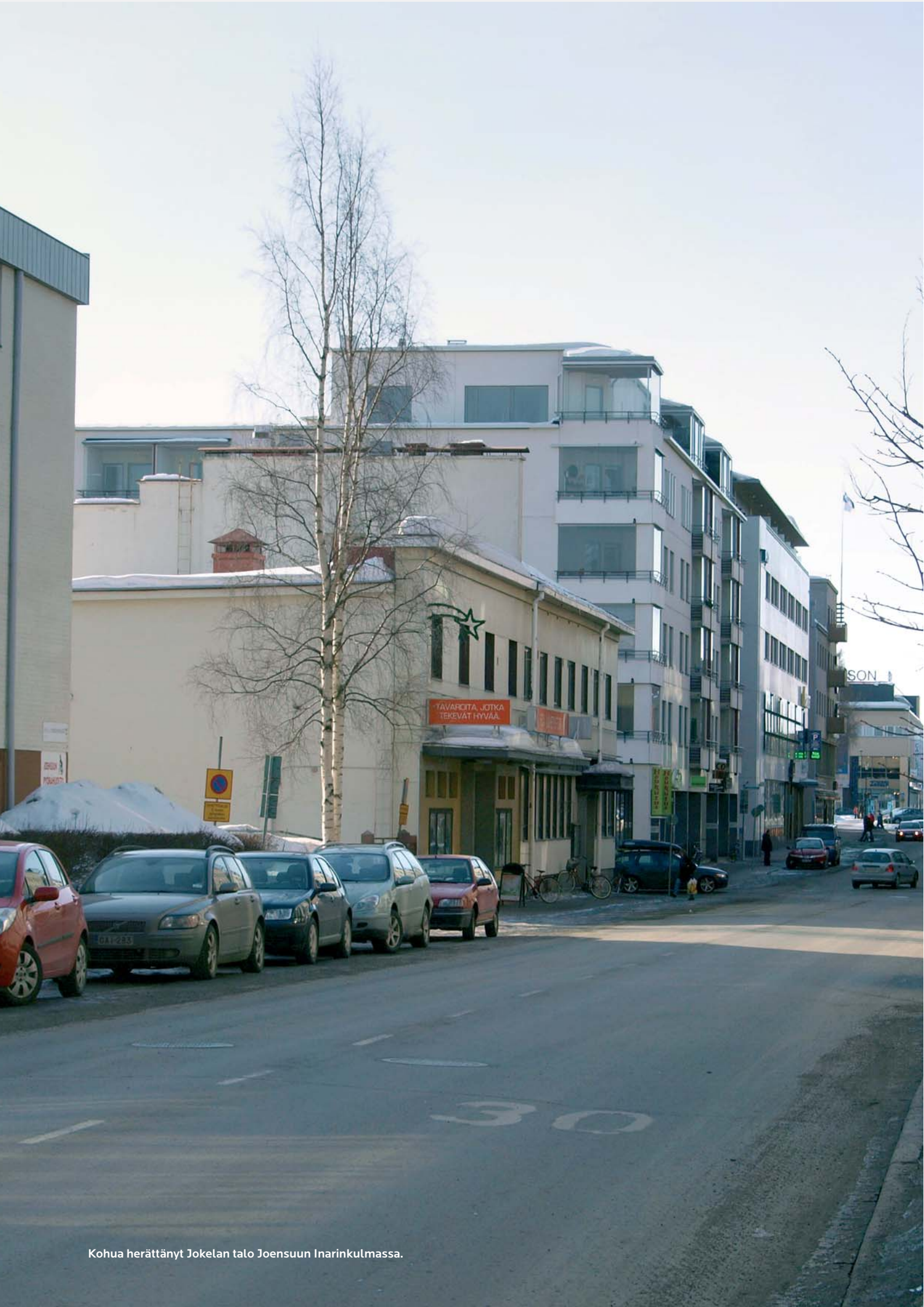
Kohua herättänyt Jokelan talo Joensuun Inarinkulmassa.